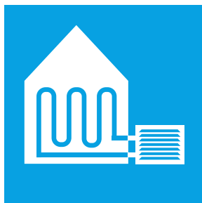
Wärmepumpe mit Aussenluft