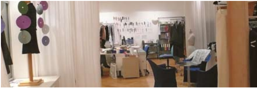
Ein Blick in das Atelier an der Bäumleingasse 22.