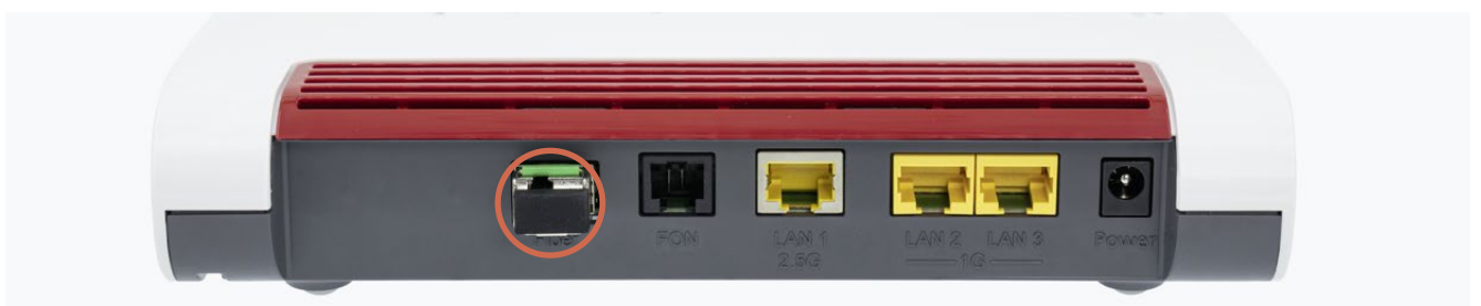
Glasfasermodul am Router