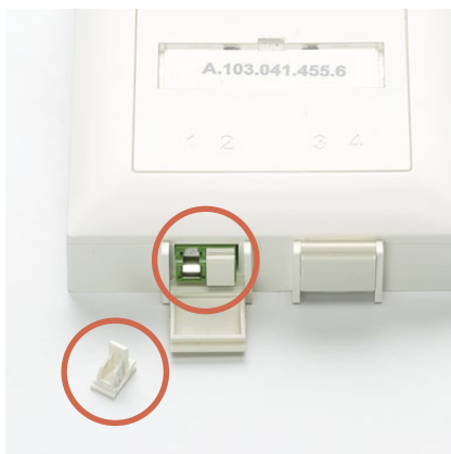
Glasfaserdose (Steckplatz 1)

Entfernen Sie die Schutzkappen an der Glasfaseranschlussdose (OTO-Dose) am Steckplatz 1, an beiden Enden des Glasfaserkabels sowie am Glasfasermodul des Routers. Das Modul selbst nicht entfernen.