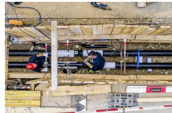
Bauarbeiten an einer Fernwärmeleitung in Riehen

Aus Sicherheitsgründen raten wir davon ab.