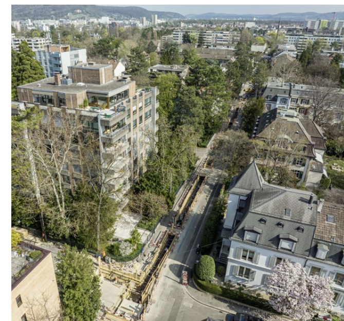
Fernwärmeausbau im Rennweg, Gellertquartier

Ebenfalls stillgelegt werden sanierungsbedürftige Gasleitungen, die künftig nicht mehr wirtschaftlich wären.