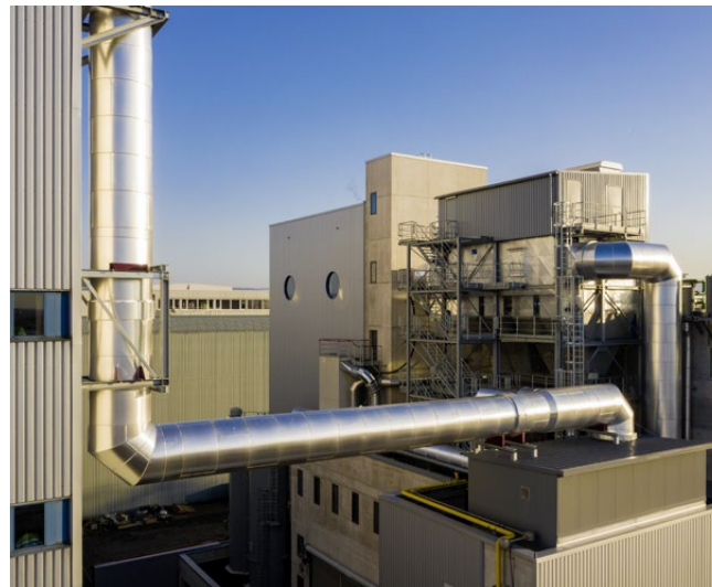
Holzkraftwerk II in Basel

IWB unterstützt alle Kundinnen und Kunden dabei, diese Vorgaben zu erfüllen. Im Einklang mit dem Energierichtplan des Kantons Basel-Stadt sorgt IWB für den notwendigen Ausbau erneuerbarer Energien und legt gleichzeitig das Gasnetz für Gebäudeheizungen und Kochherde bis 2037 schrittweise still.